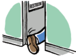
Necesita orinar más que de costumbre