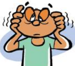
Mareos o temblores