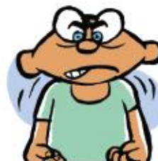
Nervioso o alterado

Si la hipoglucemia no se trata, puede causarle un desmayo. Incluso podría morir.