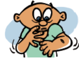
Infecciones o lesiones que tardan más en sanar