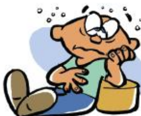
Debilidad o cansancio