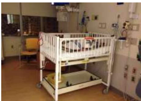
Cuna o corral

Camas térmicas : los bebés que nacen a término, pero que padecen alguna enfermedad, se colocan en camas térmicas para que el personal les administre tratamientos; allí permanecen hasta que se recuperan. Una vez recuperados, se colocan en la cuna o en el moisés.