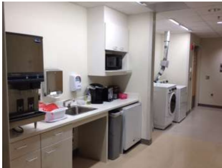
Cocina, zona de lavandería y duchas

En la sala de espera para familias hay una ducha disponible; una cocina con un microondas y un refrigerador, y una lavadora y secadora para el uso de la familia. Por favor, consuma los alimentos en el área de espera familiar. No se permiten alimentos en la habitación del bebé, aunque usted puede llevar una bebida con tapa.