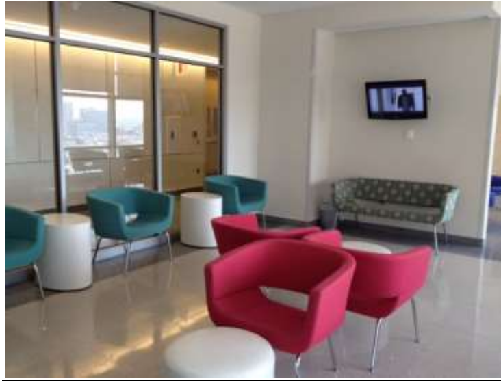
Una sala de espera amplia